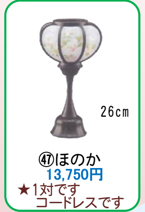
④⑦ ほのか 13,750円 ★1対です コードレスです