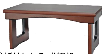
③⑥折りたたみ式経机 18号 25,300円 20号 28,600円