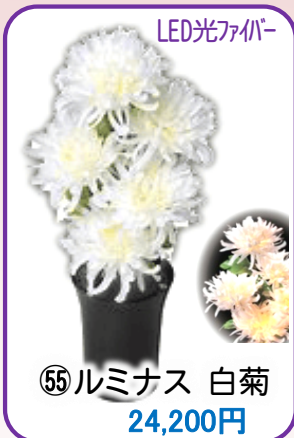
⑤⑤ ルミナス 白菊 24,200円