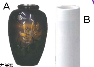
③④花瓶 A 5寸 11,000円～ B 小 1,650円～ 詳細は価格表参照