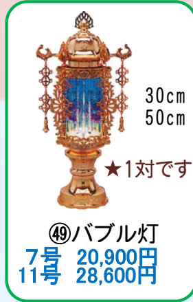
④⑨ バブル灯 7号 20,900円 11号 28,600円