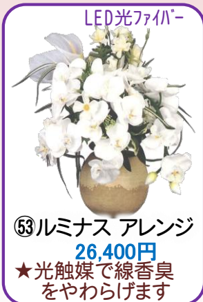
⑤③ ルミナス アレンジ 26,400円 ★光触媒で線香臭 をやわらげます