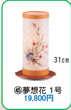
④⑤ 夢想花 1号 19,800円