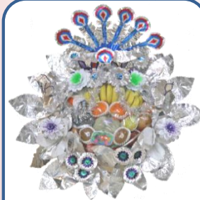
②③果物セット Aスタンド 13,200円 B花付 18,700円