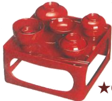
③①御霊供膳 5寸 6,490円～ 詳細は価格表参照