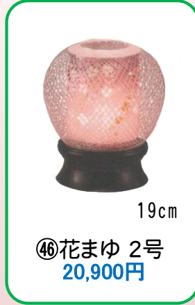
④⑥ 花まゆ 2号 20,900円