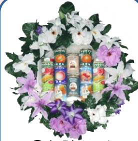
②②缶詰セット Aスタンド 13,200円 B花付 18,700円