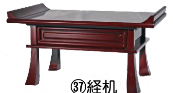
③⑦経机 18号 30,800円 20号 36,300円 ★黒檀調・紫檀調があります