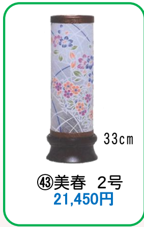
④③ 美春 2号 21,450円