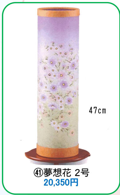
④① 夢想花 2号 20,350円