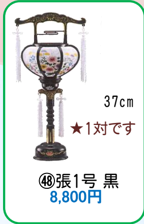
④⑧ 張1号 黒 8,800円