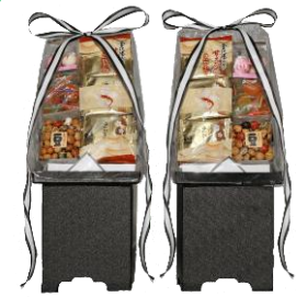
②⑦菓子盛 8,800円 ★1対です