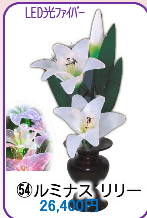
⑤④ ルミナス リリー 26,400円