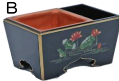
③③焼香箱 A 2,475円 B 17,424円