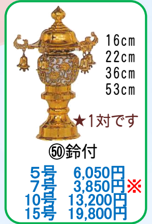
⑤⑩ 鈴付 5号 6,050円 7号 3,850円※ 10号 13,200円 15号 19,800円