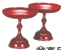
③②高月 3寸 1,650円～ 詳細は価格表参照