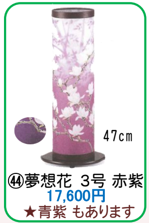
④④ 夢想花 3号 赤紫 17,600円 ★青紫 もあります