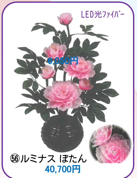
⑤⑥ ルミナス ぼたん 40,700円