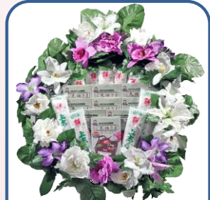
②⑥ご先祖さまセット Aスタンド 11,000円 B花付 16,500円