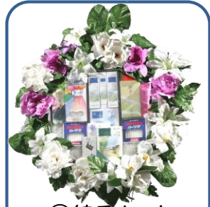
②④線香セット Aスタンド 14,850円 B花付 20,350円