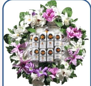
②⑤ビールセット Aスタンド 13,200円 B花付 18,700円