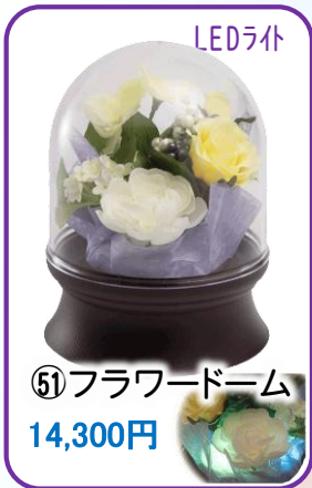
⑤① フラワードーム 14,300円