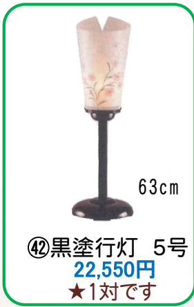
④② 黒塗行灯 5号 22,550円 ★1対です