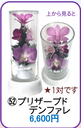
⑤② プリザーブド デンファレ 6,600円